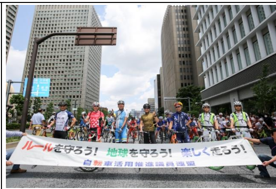
東京ステージのスタート前には平成29年5月1日に施行された「自転車活用推進法」の啓発を兼ねて、自転車安全利用を啓発するパレードを実施。