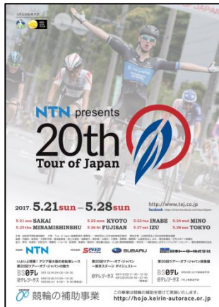
チラシ (表面)、ポスター